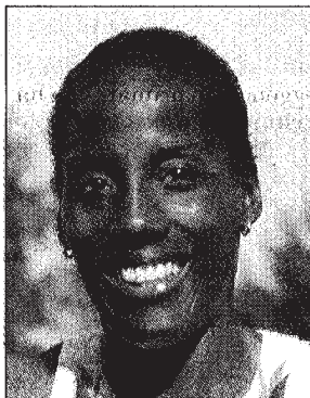
Fiona May, 39 anni